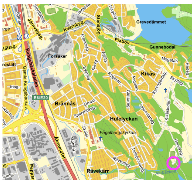
Samling söndag: Horskagatan